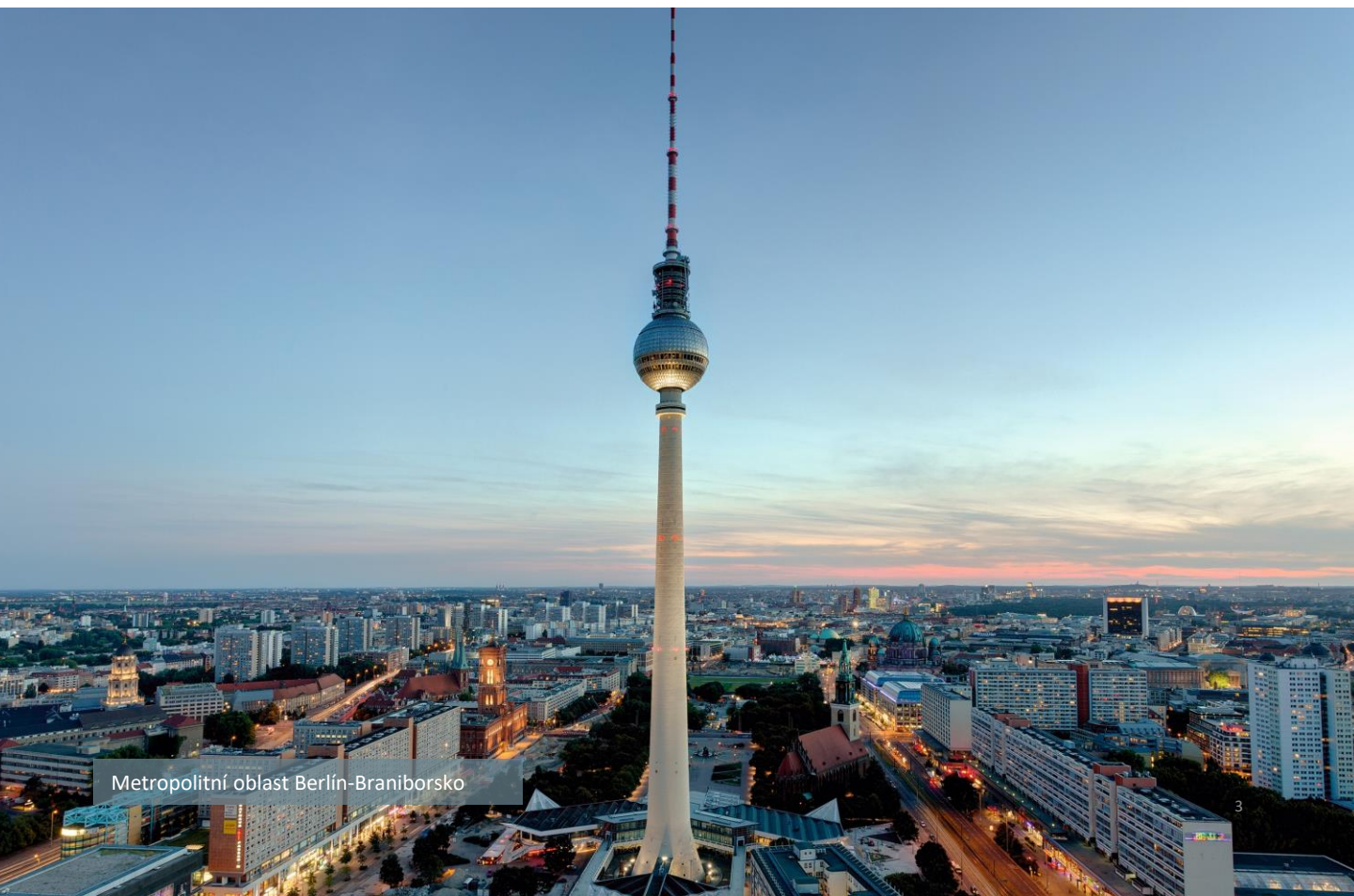
Metropolitní oblast Berlín-Braniborsko

60 % obyvatel EU žije v metropolitních regionech a oblastech.