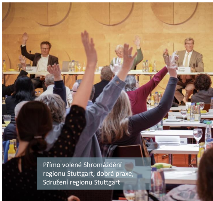
Přímo volené Shromáždění regionu Stuttgart, dobrá praxe, Sdružení regionu Stuttgart