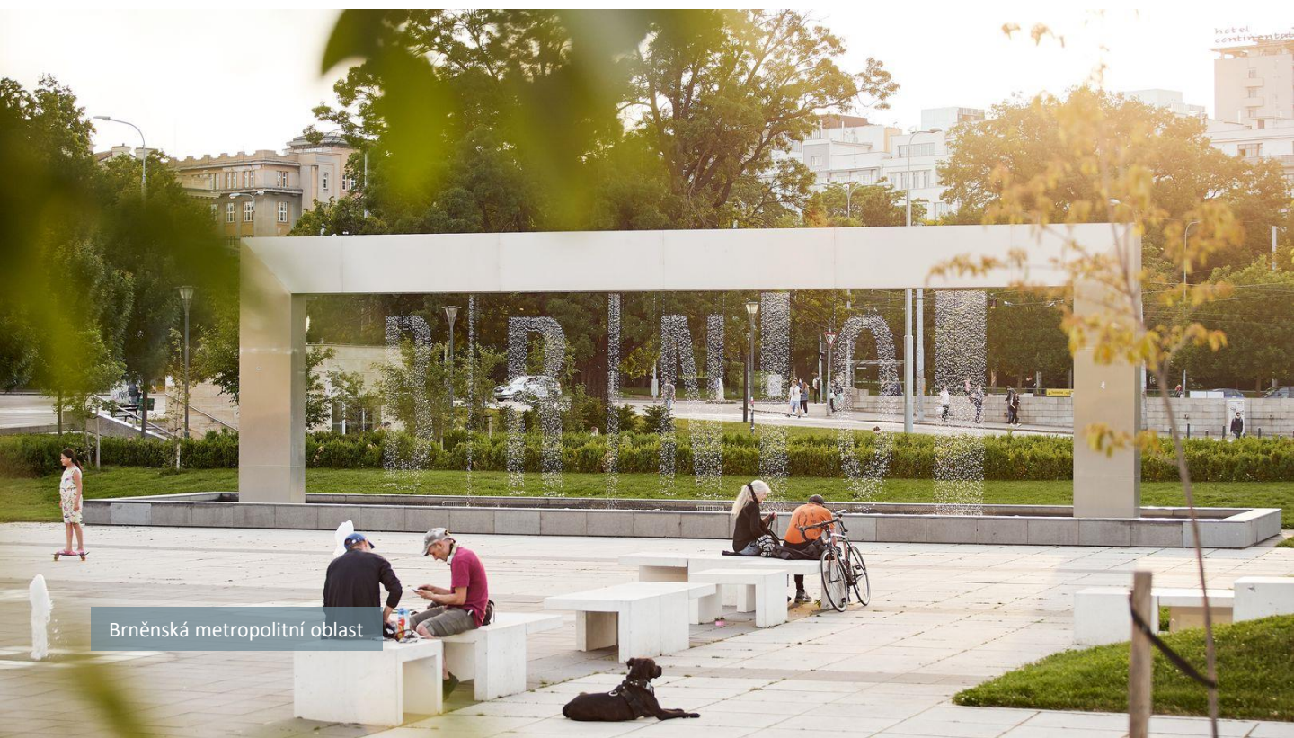
Brněnská metropolitní oblast

oceňují význam metropolitních oblastí pro společenský rozvoj. Metropolitní oblasti vynikají v technologické, společenské a organizační sféře jako globální centra výzkumu, vývoje a inovací. Kromě toho jsou také významnými centry vzdělávání, která poskytují možnosti učení na všech úrovních včetně celoživotního učení. Jejich bohatý kulturní život a rozvinuté výrobní schopnosti přispívají k dynamickému metropolitnímu prostředí, oceňovanému pro vysokou kvalitu života, podnikání a kreativitu, čímž přitahují talenty a investice. Tyto oblasti poskytují pestrou škálu pracovních příležitostí, bydlení a služeb, což lidem umožňuje snadné spojení života, práce a volnočasových aktivit. Komplexní přístup k rozvoji posiluje nejen regionální a národní konkurenceschopnost, ale také evropskou odolnost a nezávislost v globalizované ekonomice.