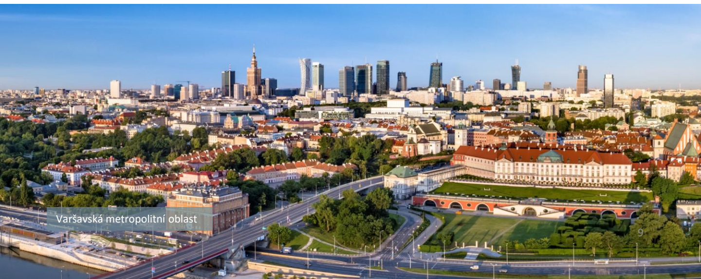
Varšavská metropolitní oblast

70 % HDP Evropské unie je produkováno v metropolitních oblastech a regionech.