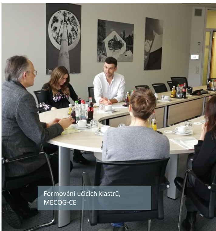
Formování učičích klastrů, MECOG-CE