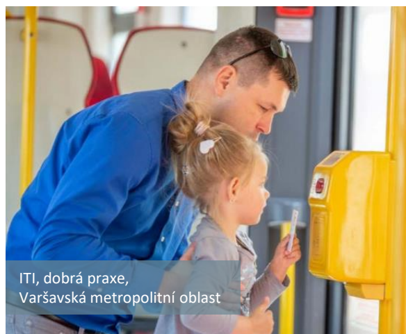
ITI, dobrá praxe, Varšavská metropolitní oblast