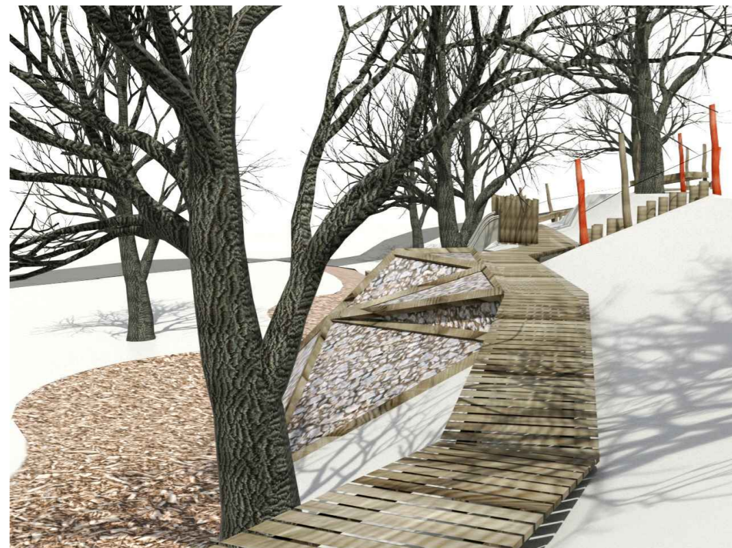
Dlouhá lávka, šikmá výlezová stěna